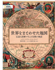
『世界をまどわせた地図』 エドワード・ブルック=ヒッチング：著 日経ナショナルジオグラフィック社：刊

情報錯綜、流言蜚語もひとたび地図に描かれればれっきとした「実在」のものに様変わり。当時に本気で信じられていた「世界〈古〉地図」を美しいオールカラー版で眺めてみよう。