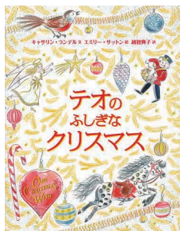
『テオのふしぎなクリスマス』 キャサリン・ランデル：著 ゴブリン書房：刊